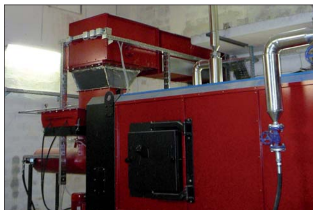
Novi kotel na lesno biomaso

Veliko energije je Energetika Sava vložila tudi v komunikacijo z odjemalci, saj se zaveda, da se morajo stroški ogrevanja zmanjšati, kar pa je zaradi stalne rasti cen energentov zelo zahtevna naloga, ki je brez racionalizacije porabe praktično nedosegljiva.